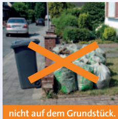
nicht auf dem Grundstück.