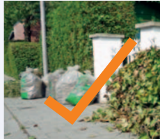
Auf dem Bürgersteig,

Längere Bäume mit/ohne Wurzelballen können kostenfrei am Entsorgungszentrum Coerde, Zum Heidehof, abgegeben werden.