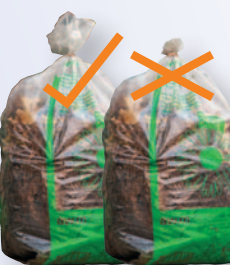
So befüllen, dass der Sack oben gut anzupacken ist.